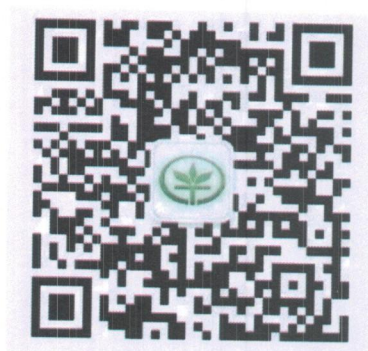
中国热带农业杂志 微信公众号