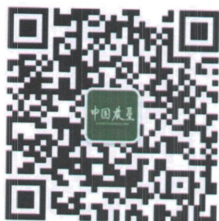
中国农垦杂志 微信公众号