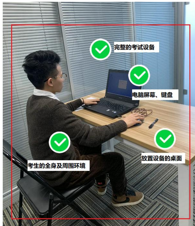
图四：佐证视频监控视角

(5) 电脑端和移动端摄像头全程开启拍摄考试过程。移动端拍摄的视频通过“智考通”上传，请耐心等待全部视频上传完成，如提示上传失败，请选择重新上传，请考生务必确认佐证视频全部上传成功。如出现视频拍摄角度不符合要求、无故中断视频录制等情况，都将影响成绩的有效性，由考生本人承担所有责任。